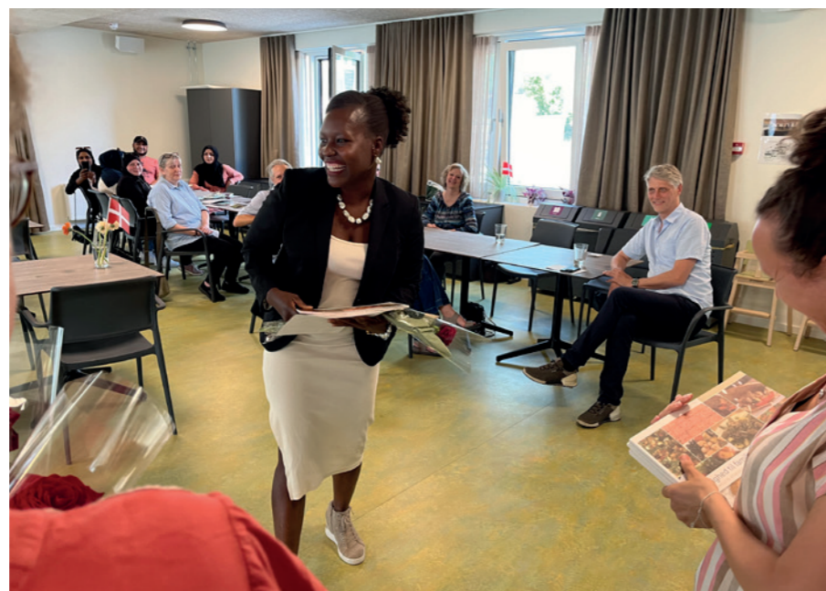
Glade kursister modtog diplom og blomster.