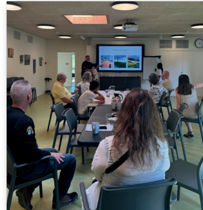
Afdelingsbestyrelsen hører om børnenes ideer.

Boliggården har siden 2020 arbejdet med at indføre børnedemokrati, hvor børn i boligområderne lærer de beboerdemokratiske spilleregler at kende.