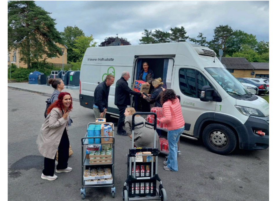
Øjeblikket ved første levering, hvor det går op for de boligsociale medarbejdere, at de ikke bare har sagt ja til én æske morgenmadsprodukt, men til en hel kasse!.

Projektet er etableret i samarbejde med Helsingør Kommune i forbindelse med Green Leaf året. FødevarerBanken har desuden fået støtte af Nordea-fonden og Lauritzen Fonden til etablering af nye madfællesskaber.