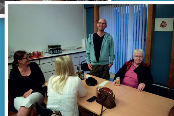
Afd. 19 - Soldal