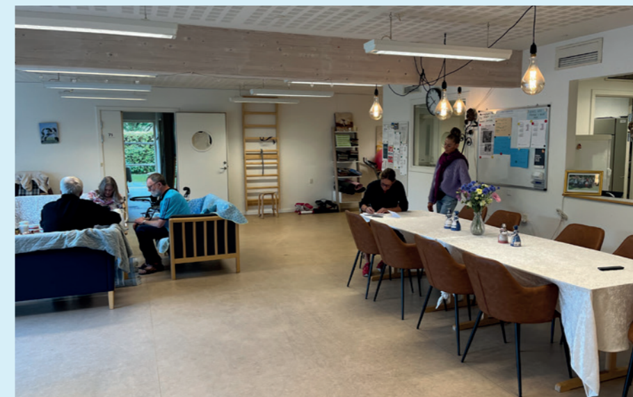
Det store opholdsrum er samlingsstedet for beboerne.