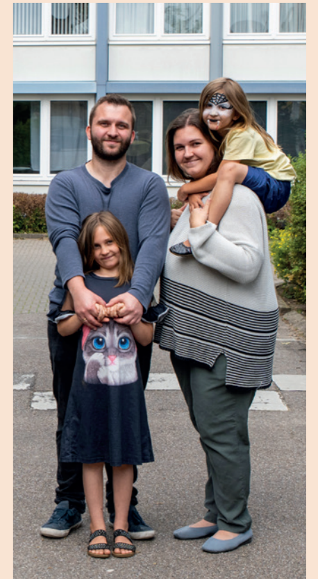
Familien sætter pris på de rolige omgivelser.