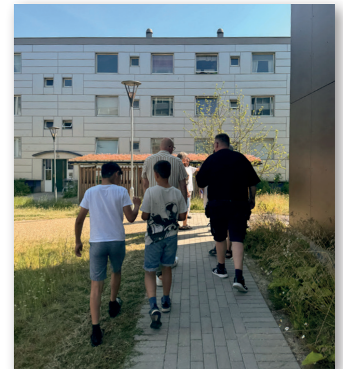
Børnedemokrater på rundtur i Nøjsomhed.