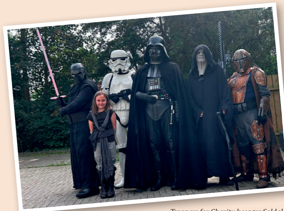
Troopers for Charity besøger Soldal.