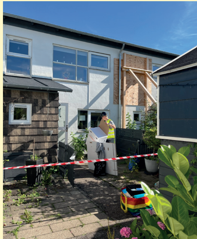
Beboerne henter mindre, personlige ejendele, efter at deres hus er grundigt sikret.

Her er en opdatering på, hvad der er sket siden seneste udgave af Tagryggen (nr. 2, juni 2024).