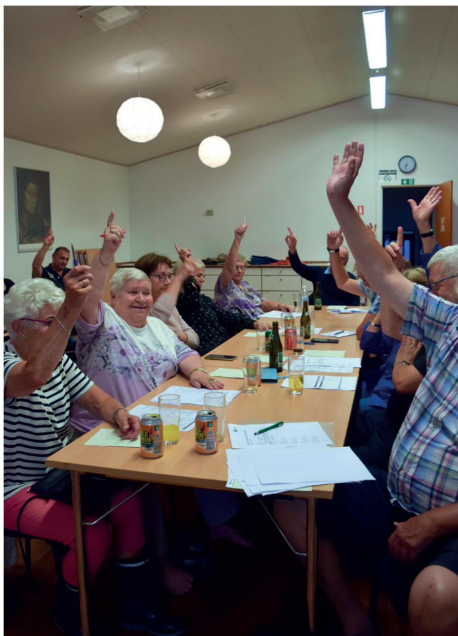
I Blicherparken var der seks forslag til afstemning.