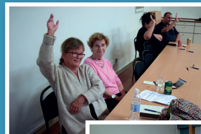
Afd. 12 - Blicherparken