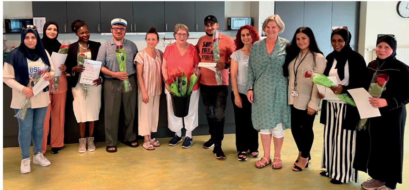
De stolte kursister med holdet bag undervisningen.

En gruppe beboere fra Helsingør området blev i juni fejret med diplom, blomster og taler som afslutning på et 19 ugers kursusforløb.