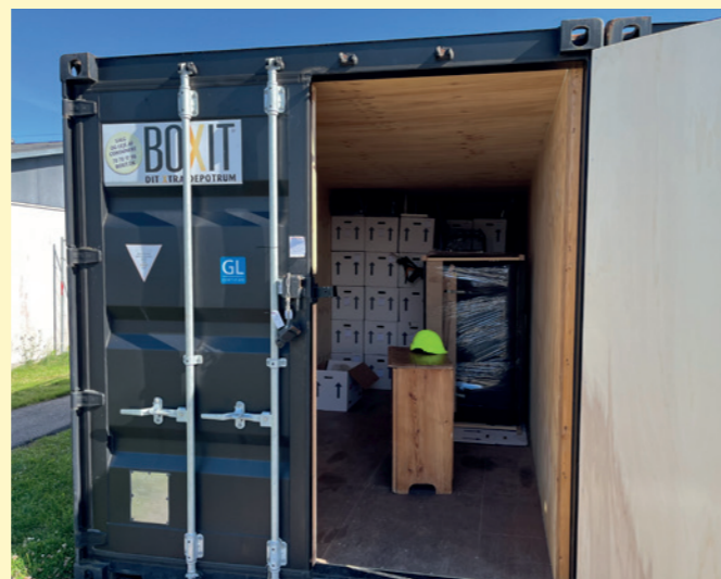
Indboet pakkes ned og flyttes til beboernes genhusningsbolig.